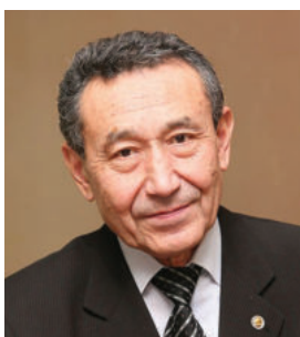
Колодезников Игорь Иннокентьевич Президент Академии наук РС (Я)