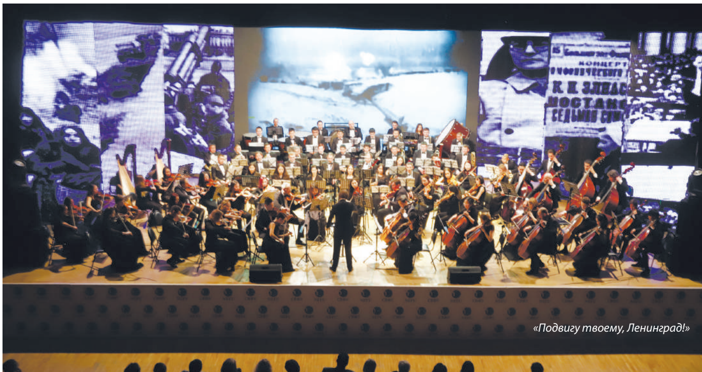
«Подвигу твоему, Ленинград!»