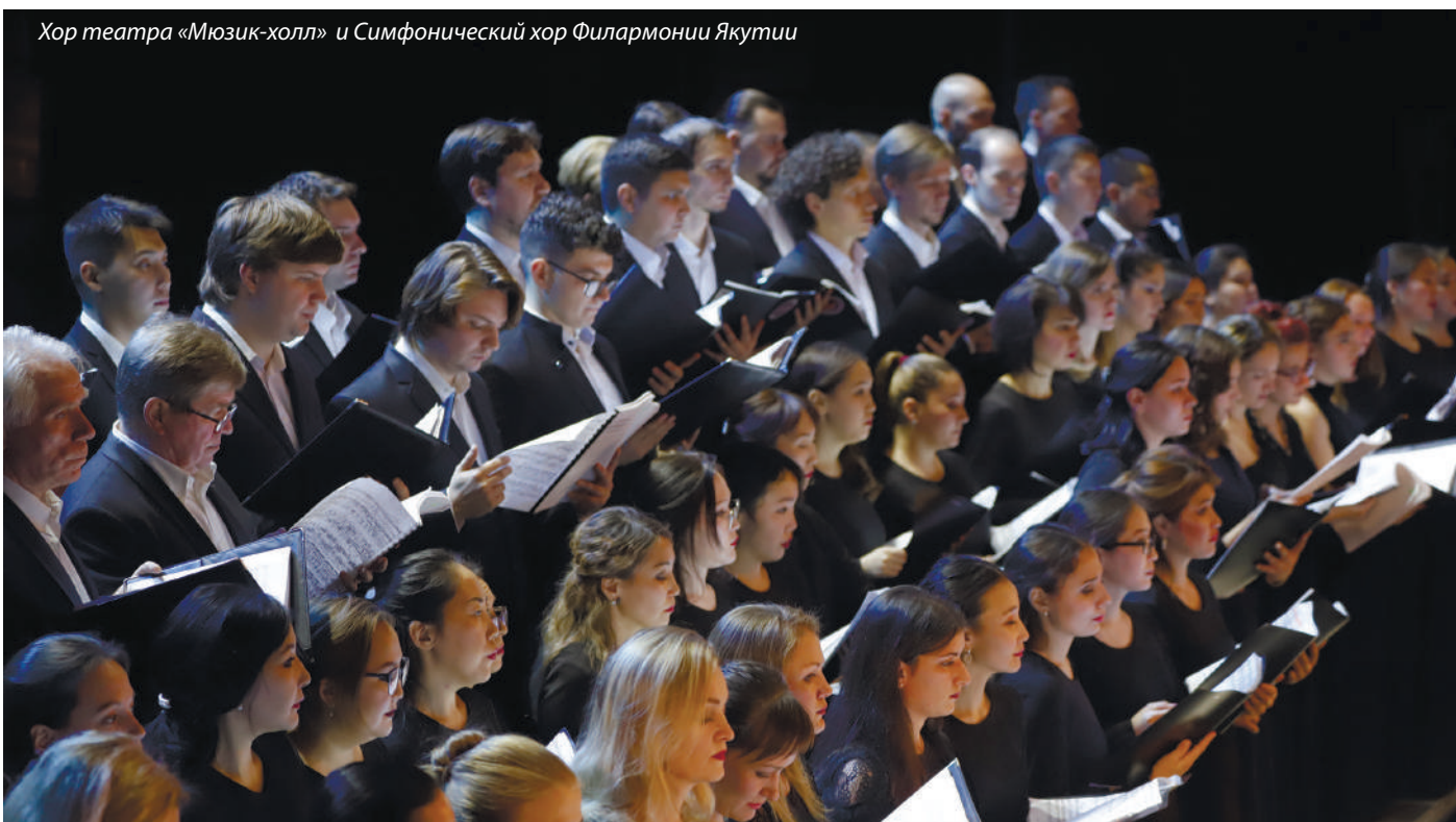
Хор театра «Мюзик-холл» и Симфонический хор Филармонии Якутии