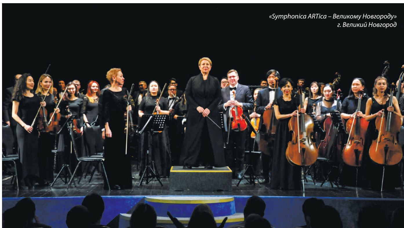
«Symphonica ARTica – Великому Новгороду» г. Великий Новгород