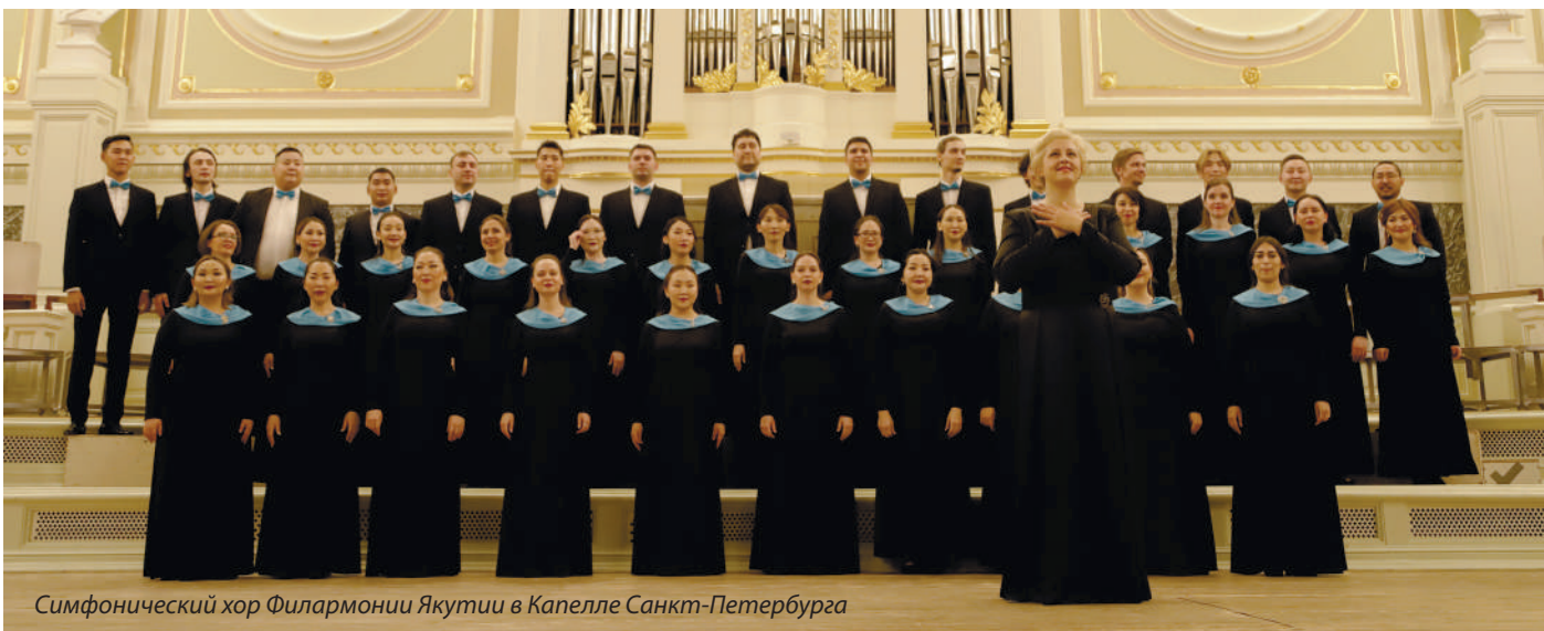
Симфонический хор Филармонии Якутии в Капелле Санкт-Петербурга